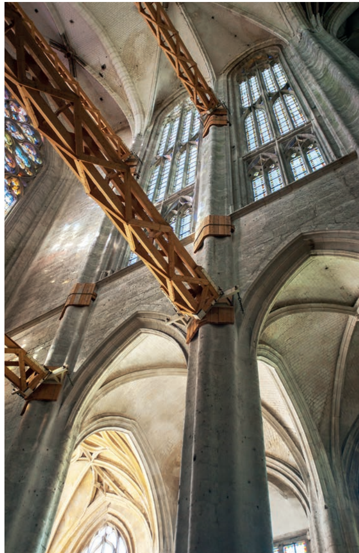
Kathedrale St. Pierre in Beauvais, hölzerne Stützpfiler

Hinterfragt werden muss längst nicht nur die aktuelle Struktur der kath. Kirche, die Ämterfrage oder das Konstrukt des Lehramts. Laut Christiane Bundschuh-Schramm befinden wir uns in einer theologischen Krise, in der »das zweite (jenseitige) Stockwerk« nicht mehr als Fluchtpunkt und das zukünftige Reich Gottes nicht mehr als Zielpunkt zur Verfügung stehe. Mit durch die Corona-Krise sei der göttliche Plan und das Vertrauen auf den guten Ausgang schal und wenig überzeugend geworden. Entdeckt werden kann Gött-